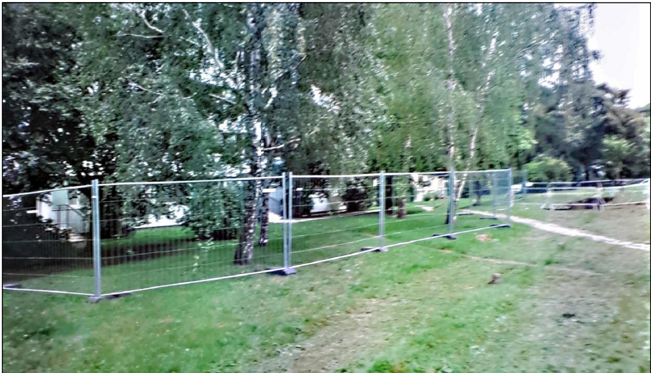
ALTERNATÍVA: STAVEBNÉ. OPLOTENIE